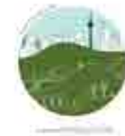
PUENTE DE VALLECAS