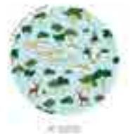
FUENCARRAL - EL PARDO