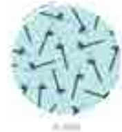
MONCLOA - ARAVACA