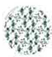
SAN BLAS - CANILLEJAS