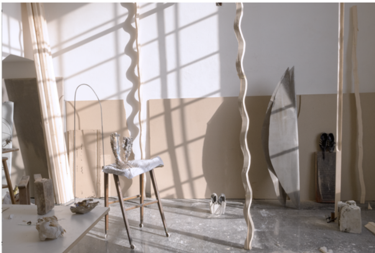
Estudio 23. Academia de España en Roma

Exposición de los artistas e investigadores de la Academia de España en Roma 2017-2018