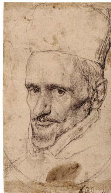
Diego Rodríguez de Silva y Velázquez. Estudio para el retrato del cardenal Borja. 1643-1645. Lápiz negro sobre papel verjurado. 188 x 116 mm [D2211].