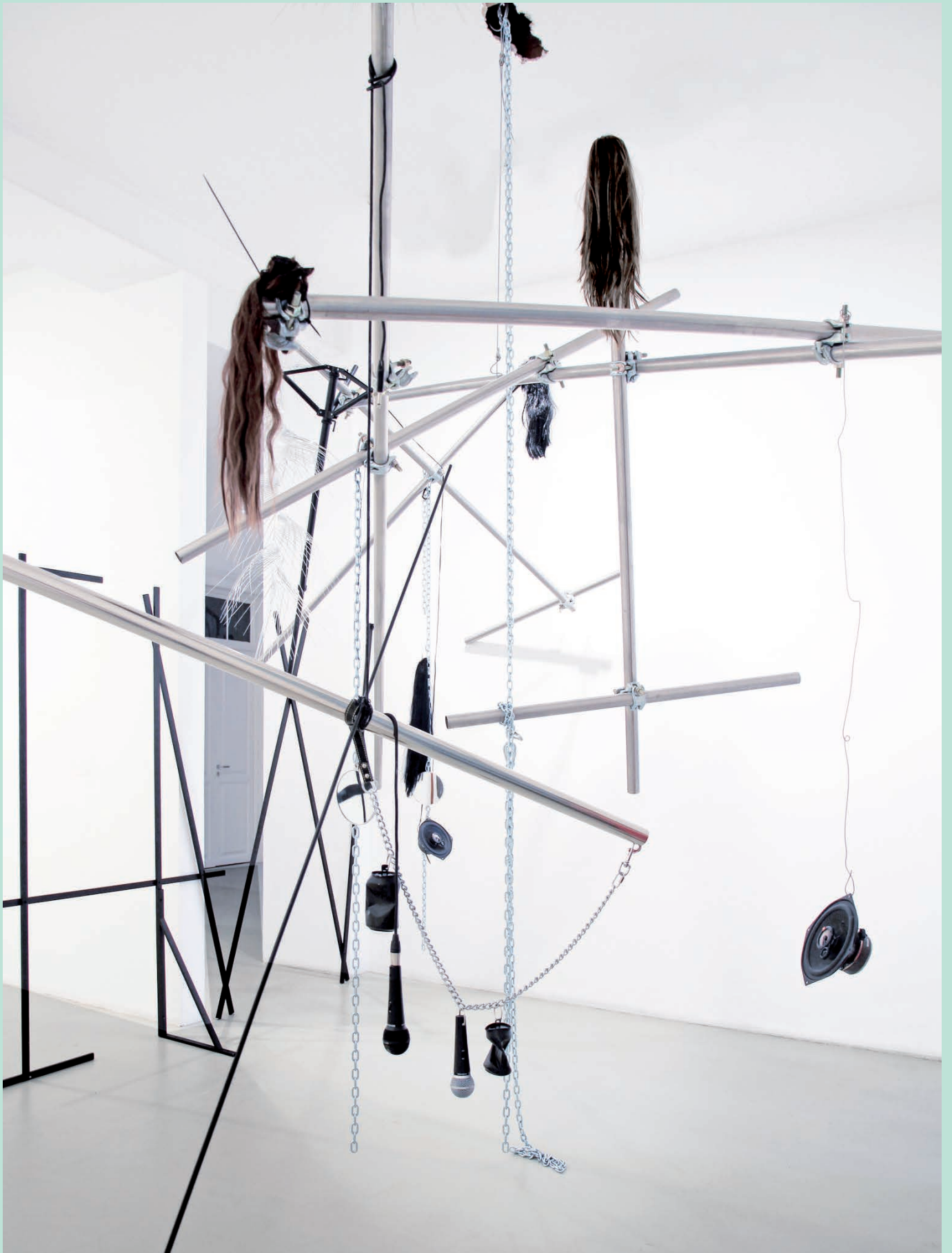
Pepo Salazar , When cut across the neck a sound like willing winter wind is heard (they say) , 2012 Installation view.