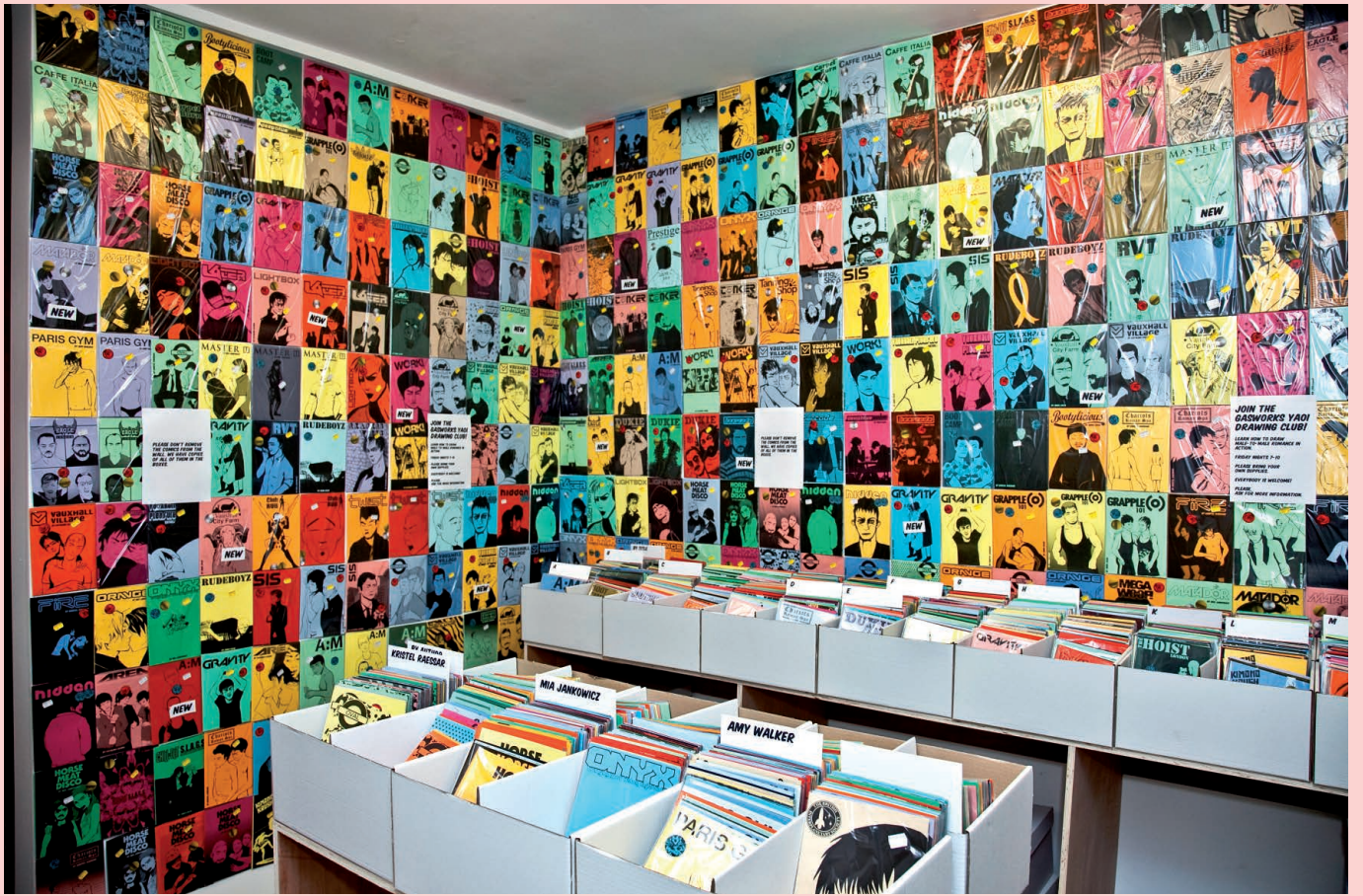
Francesc Ruiz, Gasworks Yaoi , 2010