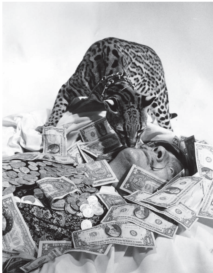
© Halsman Archive Derechos de Imagen de Salvador Dalí reservados. Fundació Gala-Salvador Dalí, Figueres, 2015.

Los artistas Cabello/Carceller, Francesc Ruiz y Pepo Salazar, con el hábito de Salvador Dalí, serán los protagonistas del Pabellón de España en la 56 edición de la Bienal de Venecia que abrirá sus puertas el próximo 9 de mayo. El comisario Martí Manen desarrollará un proyecto coral en el que Dalí estará presente como sujeto pero no con obra. Una relectura y reposicionamiento de Dalí desde el punto de vista contemporáneo a través de las voces de Cabello/Carceller, Francesc Ruiz y Pepo Salazar.