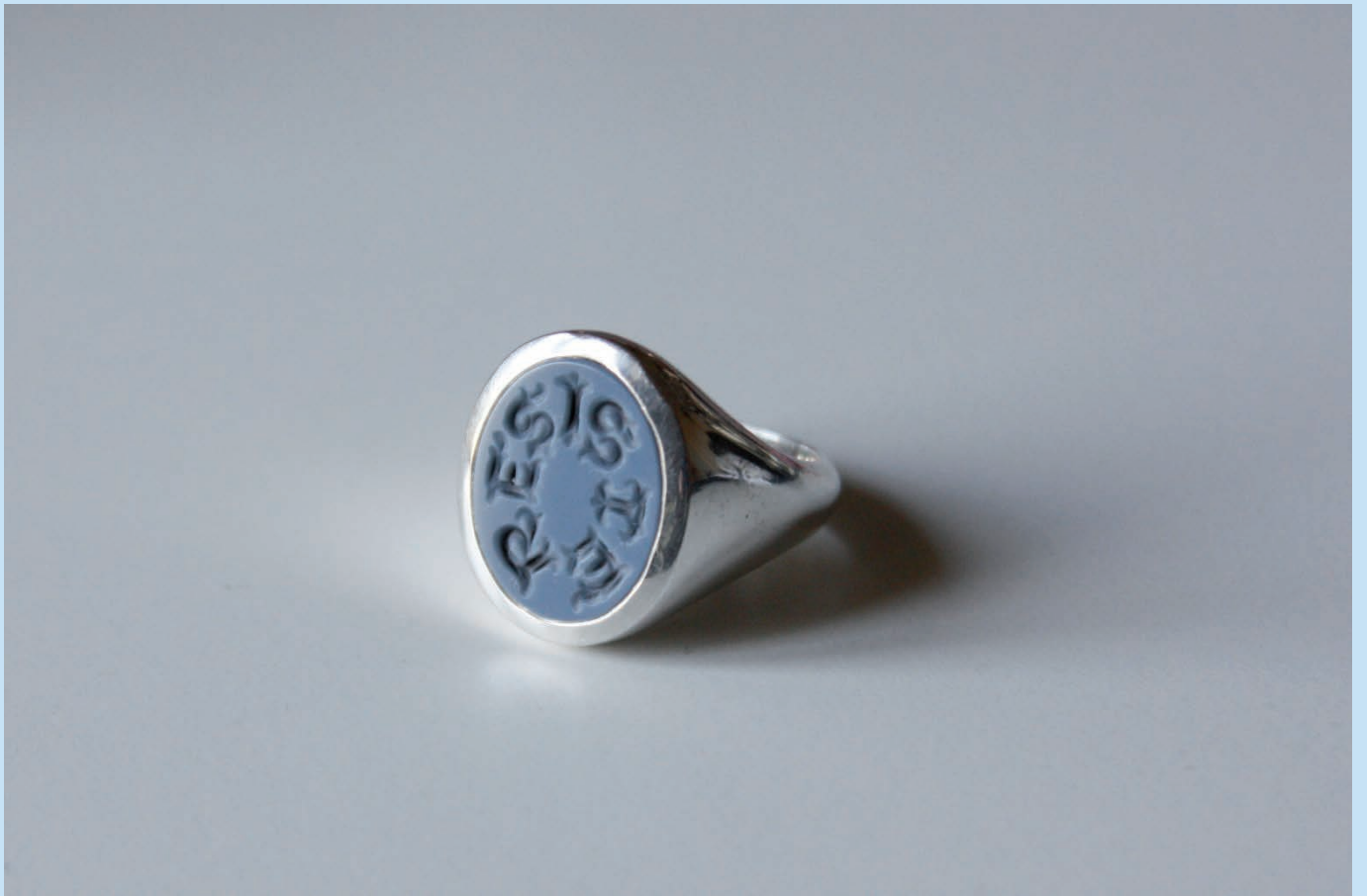
Cabello/Carceller , The State of the Art (still), 2015, HD video