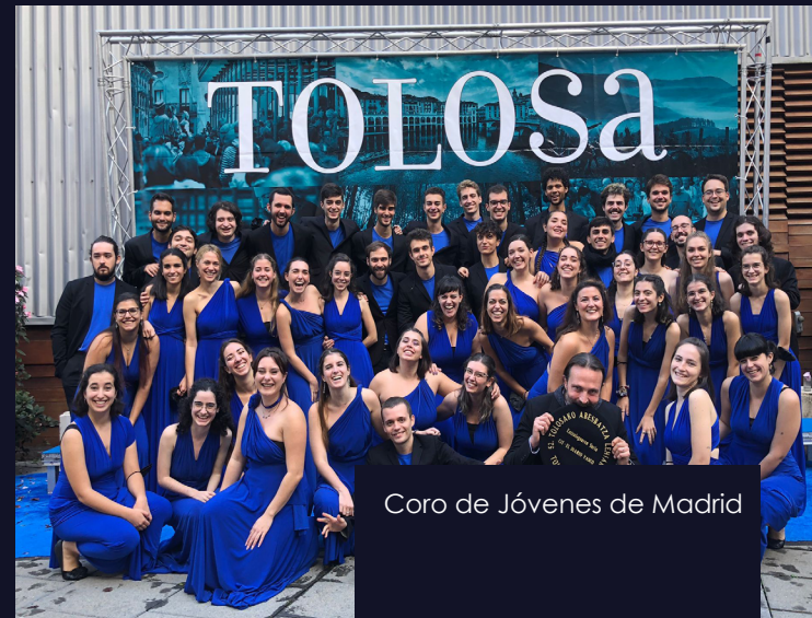
Coro de Jóvenes de Madrid