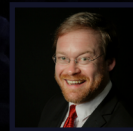
Jan Schumacher Vicepresidente de la Asociación Coral Europea - Europa Cantat

Las habilidades vocales sobresalientes de los jóvenes completan la imagen de ser uno de los mejores coros juveniles de Europa en nuestros días.”