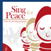
Sing for Peace (2014)