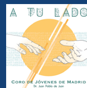
A tu lado (2018)